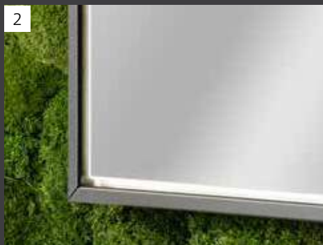
LED-Spiegelschrank W1 als Einbauversion, Korpus Schwarz, Breite 102 cm