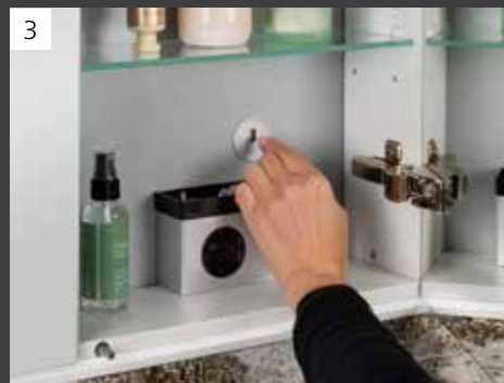
Optimale Lichtsteuerung des umlaufenden LED-Silikonbands dank eines stufenlosen Dimmers mit Memoryfunktion (E-Box mit 2 Steckdosen)