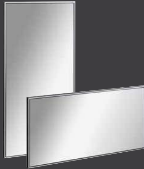
Spiegelement Alu Schwarz, dimmbar mit Sensorschalter und Memoryfunktion, quer und hochkant einsetzbar