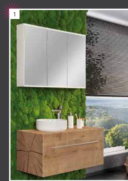
Highlight LED-Spiegelschrank W1, Korpus Weiß auf der Wand montiert